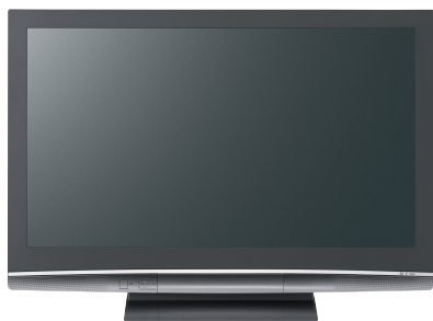
デジタルチューナー内蔵テレビ (液晶テレビ・プラズマテレビ など)

従来のアナログテレビでも、デジタルチューナー、またはデジタルチューナー内蔵録画機を取り付ければ視聴できます。ただし、お使いの受信機によって画質などは異なります。